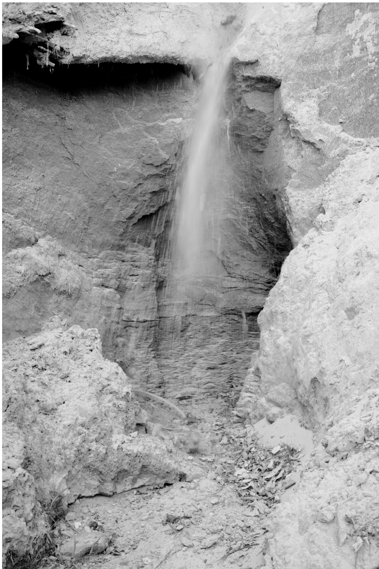
Liya Mikhailova, extrait de la série photographique The Shore That Whispers , 2024 Лия Михайлова, из фотосерии Берег, что рассыпается , 2024