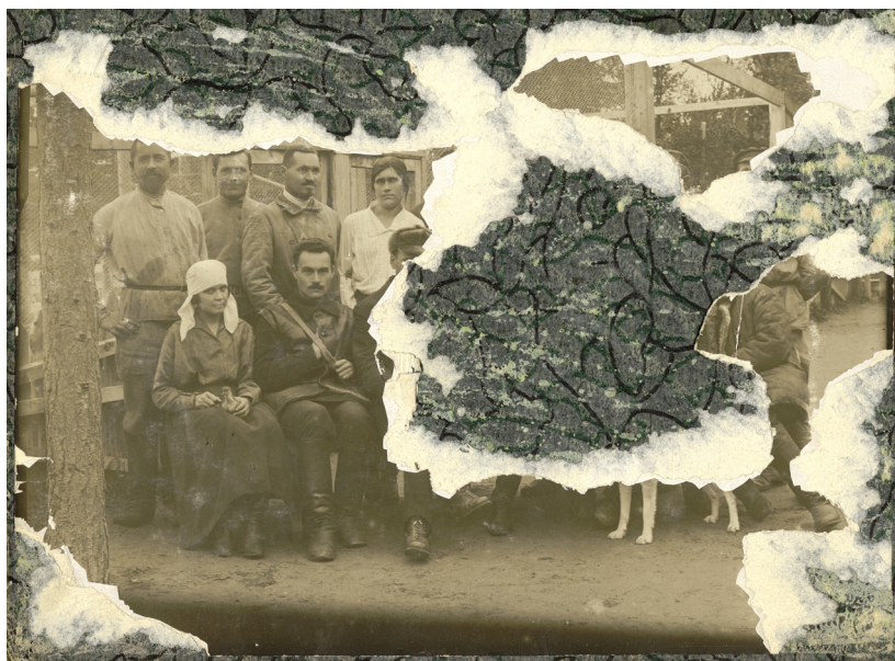
Image du haut : Pact of Silence , vue de l'installation; photo : Ivan Erofeev, 2016